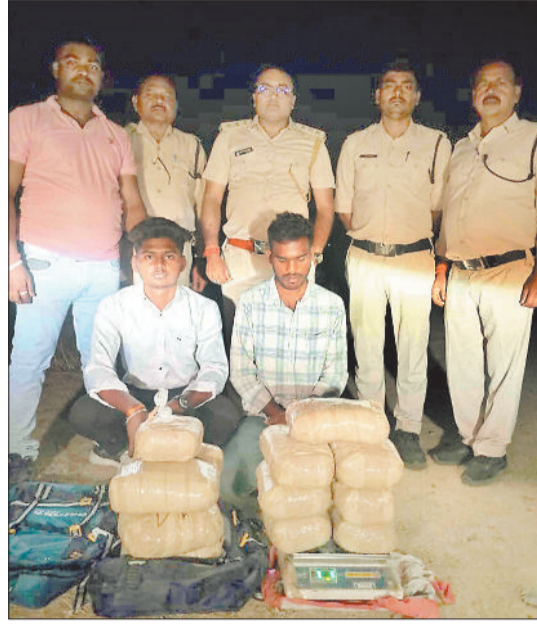
जळ गांजा के साथ आरोपी।