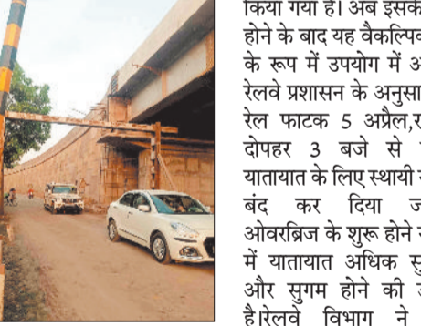
फाटक) के स्थान पर सड़क सुरक्षा को ध्यान में रखते हुए रोड ओवरब्रिज का निर्माण किया गया है। अब इसके चालू होने के बाद यह वैकल्पिक मार्ग के रूप में उपयोग में आएगा। रेलवे प्रशासन के अनुसार, यह रेल फाटक 5 अप्रैल, रविवार दोपहर 3 बजे से सड़क यातायात के लिए स्थायी रूप से बंद कर दिया जाएगा, ओवरब्रिज के शुरू होने से क्षेत्र में यातायात अधिक सुरक्षित और सुगम होने की उम्मीद है। रेलवे विभाग ने आम नागरिकों से अपील की है कि वे अपनी सुरक्षा के लिए नए वैकल्पिक मार्ग का उपयोग करें।

बिभ्रामपुर-भटगांव मार्ग पर दक्षिण समीप रेलवे द्वारा निर्मित रोड ओवरब्रिज को आमजन के लिए खोल दिया गया है, इसके साथ ही कुमदा स्थित समपार रेल फाटक को स्थायी रूप से बंद करने का निर्णय लिया गया है। दक्षिण पूर्व मध्य रेलवे, बिलासपुर मंडल के अंतर्गत बिभ्रामपुर-करंजी स्टेशनों के बीच किलोमीटर 1016/04-05 पर स्थित मानव सहित समपार संख्या एबी-69 (कुमदा रेल